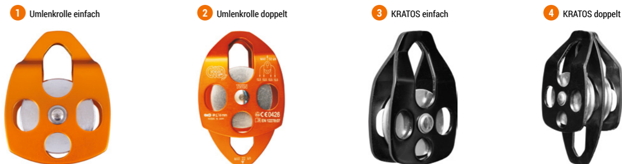
1 Umlenkrolle einfach pulley for rescue 2 Umlenkrolle doppelt doppelte Umlenkrollen für Flaschenzüge und Rettungseinsätze double pulleys for hauling systems and rescue 3 KRATOS einfach Umlenkrolle für Rettungseinsätze pulley for rescue 4 KRATOS doppelt doppelte Umlenkrollen für Flaschenzüge und Rettungseinsätze double pulleys for hauling systems and rescue